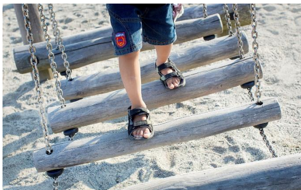
De ansatte i barnehage, skole og SFO kan skape sammenheng ved å være brobyggere mellom institusjonene. (Thoresen, Aukland 2020)

Målgruppen er alle barnehager, barneskoler og SFO i Sola. For å oppnå en god sammenheng for barnet i overgangen må barnehage – skole og SFO ha god nok kunnskap om hverandres profesjon, avklare forventninger og ha faste rammer med møtepunkt for dialog. Foreldrene er en ressurs og en viktig samarbeidspartner i dette arbeidet. SFO er ofte den første arenaen barnet møter som skolestarter. SFO står i en særstilling i mellomrommet mellom barnehage og skole, denne særstillingen og SFO sin betydning i overgangen skal få større kraft i Sola.